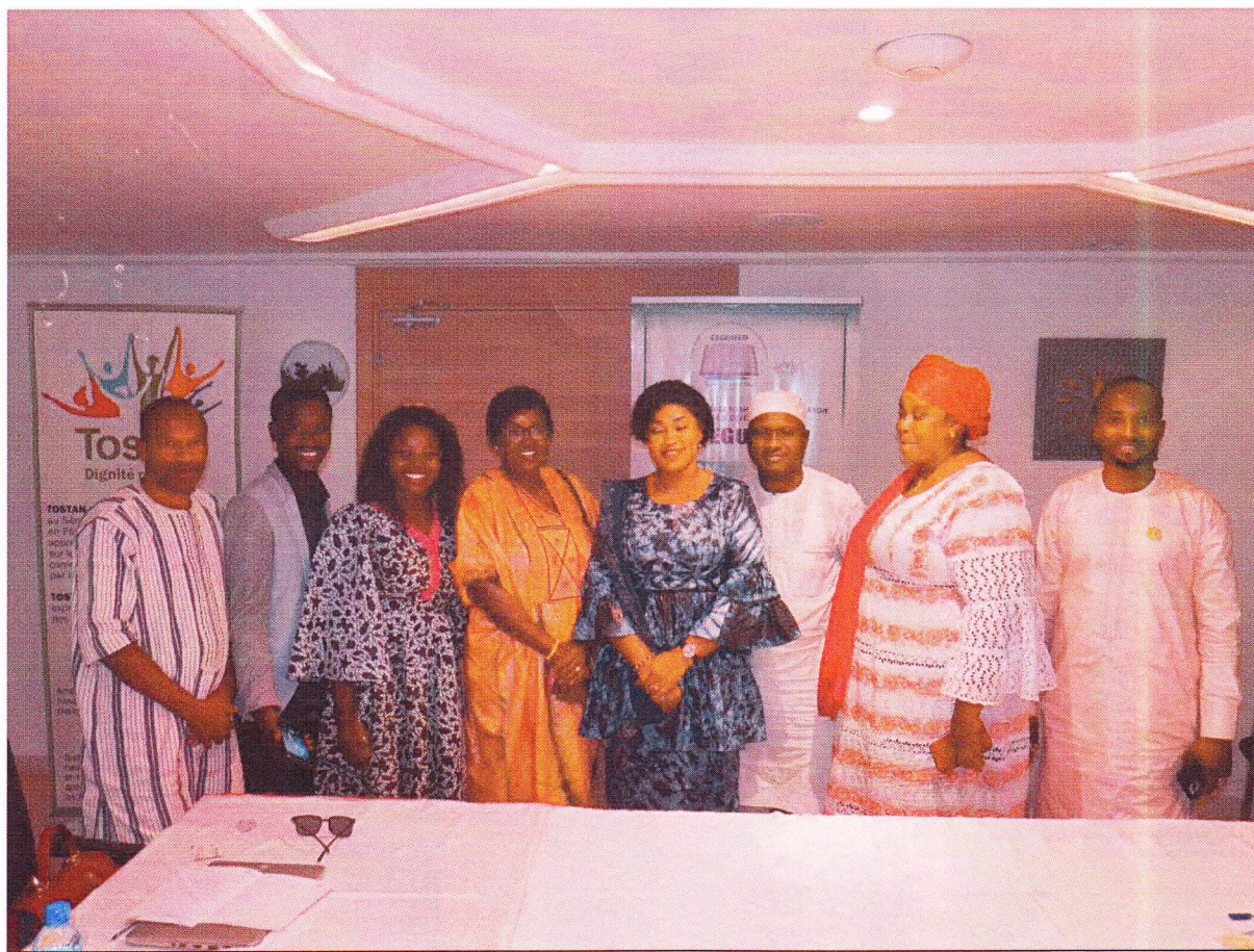
PHOTO DE FAMILLE DES PARTICIPANTS A LA PREMIERE SESSION DU CONSEIL D'ADMINISTRATION DE CEGUIFED – 24 NOVEMBRE 2023