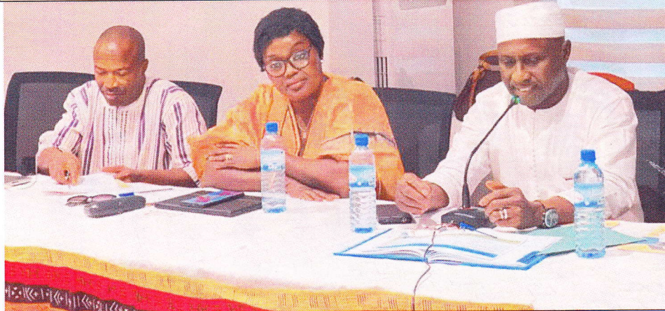
L'intervention du Président du Conseil d'Administration après son élection