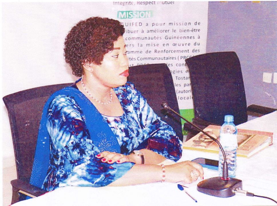
Madame la Directrice Nationale de Régulation et de Promotion des ONG et Mouvement Associatif (DNARPROMA)